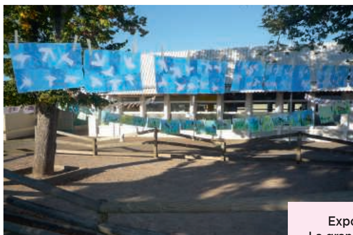
Exposition La grande lessive

La grève des enseignants a été très suivie. 10 enfants étaient présents au service minimum obligatoire.