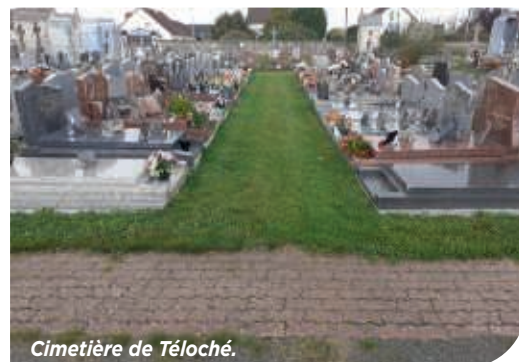
Cimetière de Teloché.

Ces aménagements vont dans le sens d'une écologie responsable.